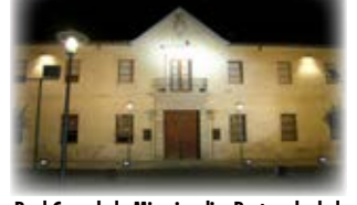
Real Casa de la Misericordia. Rectorado de la Universidad de Castilla-La Mancha