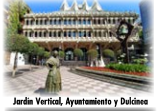
Jardín Vertical, Ayuntamiento y Dolina