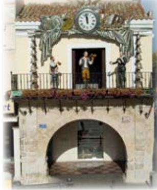
Carrillón Plaza Mayor