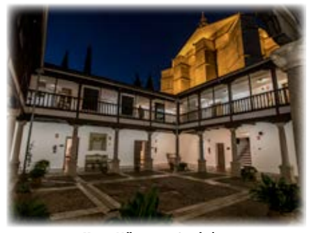
Museo Villaseñor y Catedral