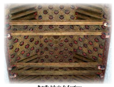
Detalle Iglesia de Santiago