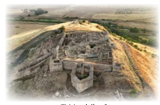
"Yacimiento de Alarcos"

The history of Ciudad Real begins 8 km away, in the 38.) Alarcos Archaeological Park , where you can visit the Interpretation Centre and the Archaeological site. The excavations performed since the 1980's have discovered the remains of human settlements from the Bronze Age, the Iron Age and the Middle Ages, including many artifacts that tell us about the 1195 Battle of Alarcos. The ensemble consists also of a castle at the highest point and the beautiful gothic style sanctuary devoted to the Virgin of Alarcos.