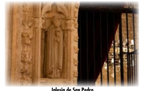
Iglesia de San Pedro