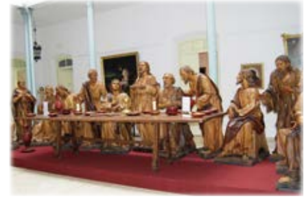
Museo Diocesano de Ciudad Real